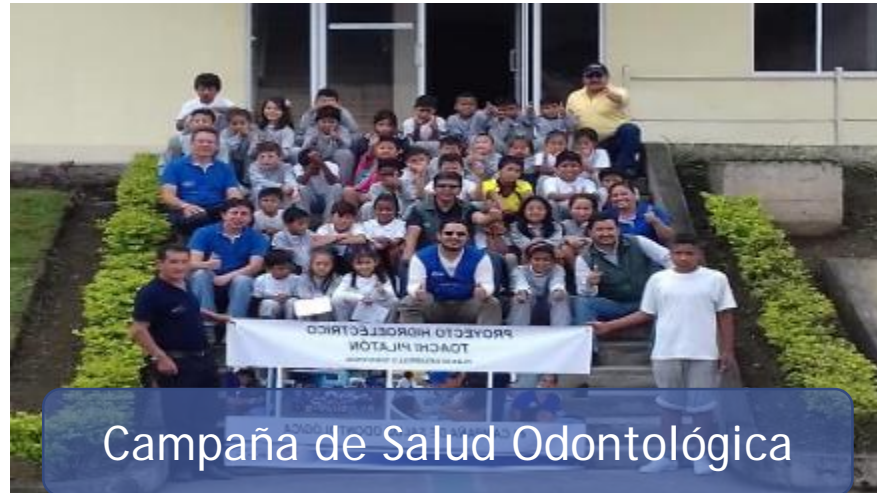
Campaña de Salud Odontológica