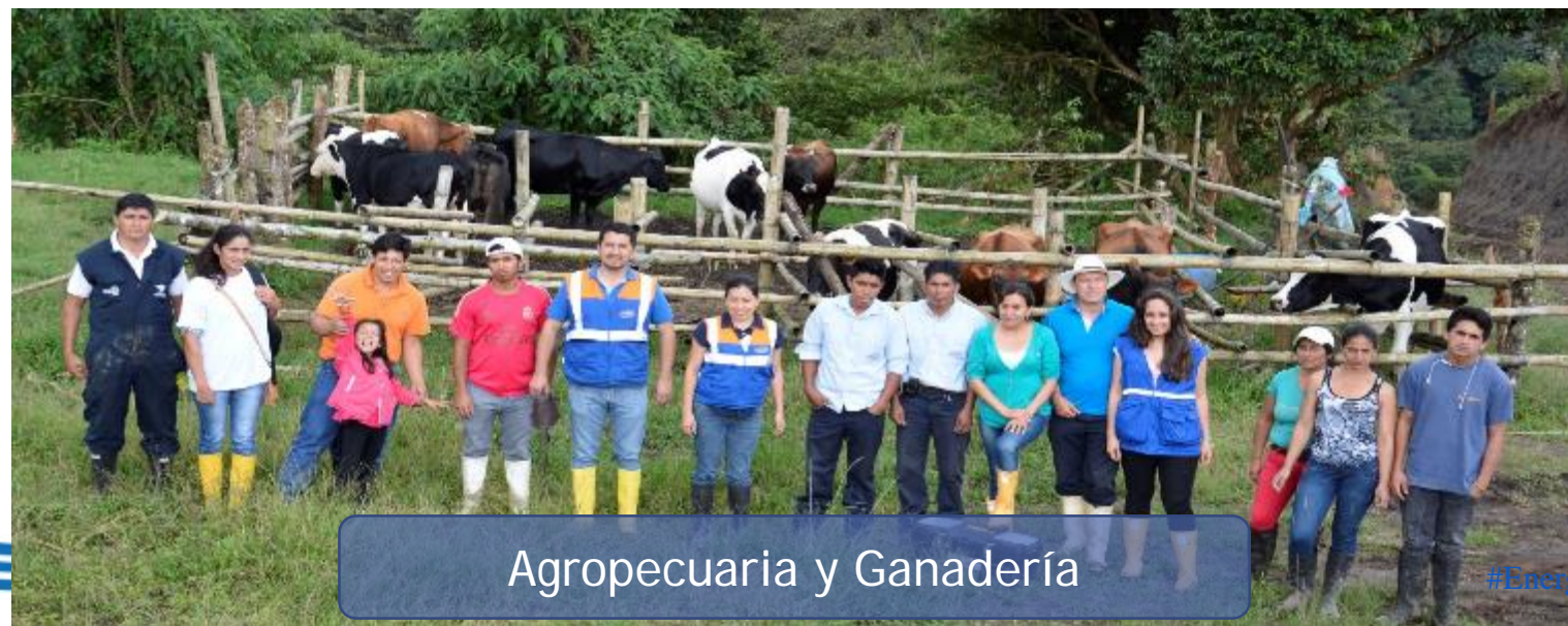
Agropecuaria y Ganadería