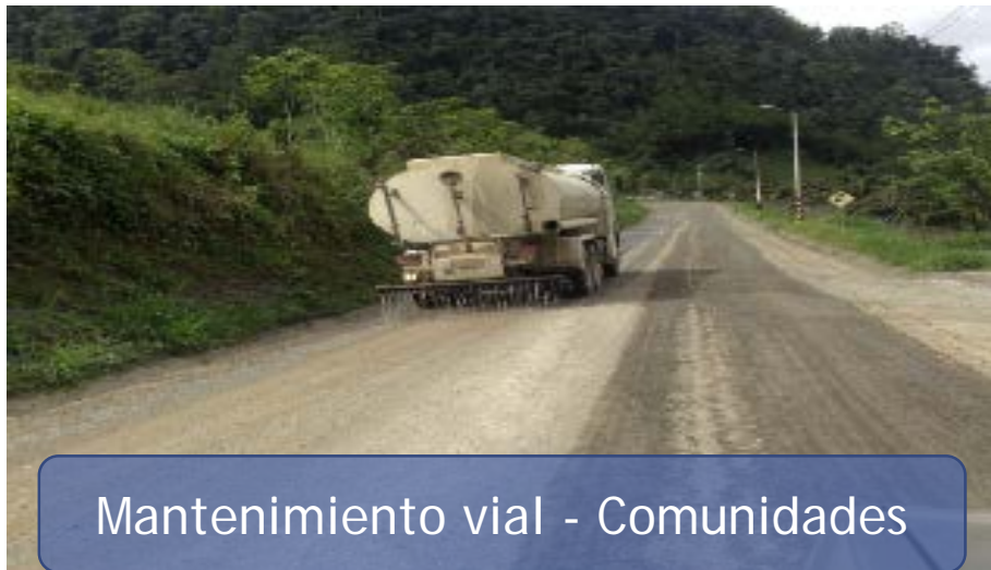
Mantenimiento vial - Comunidades