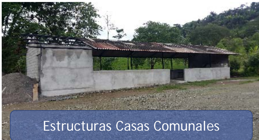
Estructuras Casas Comunales