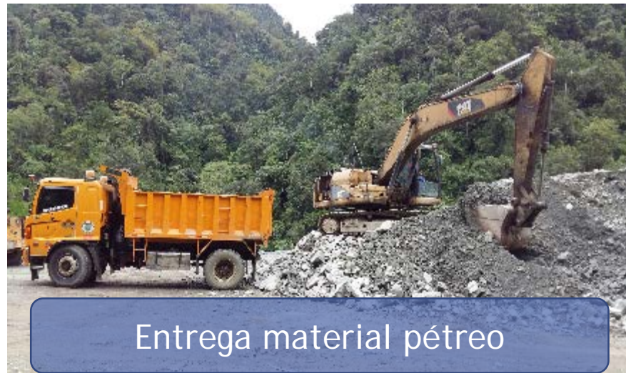
Entrega material pétreo